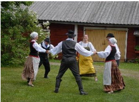
Kuva 1. Kansantanssija Venäjän Karjalasta.

SUKUKOKOUS 9.6.2018 Honkavaaran Perinnepiha, Pyhäselkä